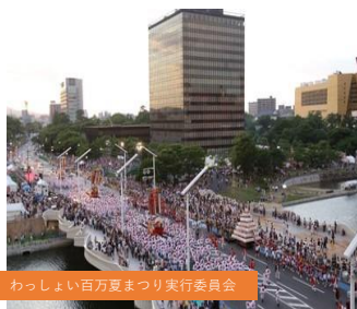
わっしょい百万夏まつり実行委員会