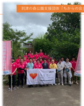
到津の森公園支援団体「ちからの会」

じですか？ その危機に際し、青年会議所や多くの団体が署名を集め存続運動を行いました。結果、北九州市に引き取って頂き、北九州市の動物公園として存続する事になりました。しかし、市から「この動物公園は北九州市民の想いで存続されました。二度と閉園の危機にならないように、これからもバックアップしてください」とお願いされました。その経緯で結成されたのが「到津の森ちからの会」です。この4月から、私が会長職をお預かりする事となりました。皆さまにもぜひご支援いただければと思います。しかし、ボランティアの方々が活動に疲弊したり、マンパワーが足りなかったり、資金不足になりお金集めに奔走したり、継続していくのが難しいのも事実です。先程の2つの事例のような、歴史や社会的インパクトがあるものは比較的継続しやすいですが、もっと小さな地域の課題やこれからの未来への挑戦などはボランティア事業ではなかなかカタチになりません。