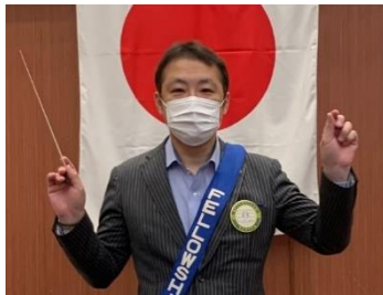
ロータリーソング 白石会員