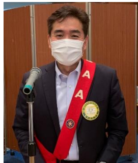
本日の司会進行 副 S A A 川原会員