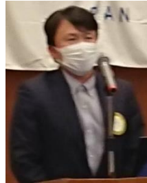
四つのテスト 八頭司会員