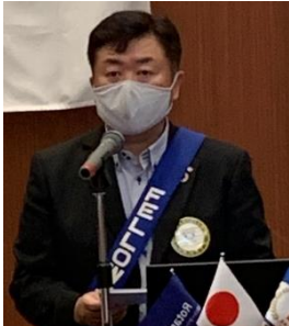
ニコニコ BOX 紹介 有吉会員