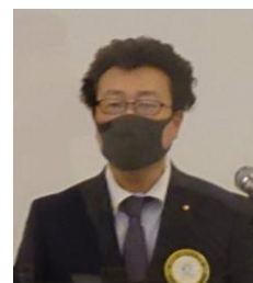
四つのテスト 植木会員