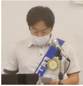
ニコニコBOX紹介 瀧口会員