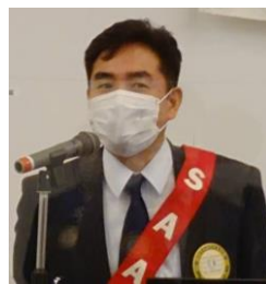
四つのテスト 川原会員