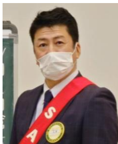
本日の司会進行 副SAA 三箇会員