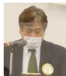
出席状況報告 安部会員