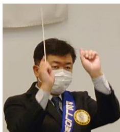
ソングリーダー 有吉会員