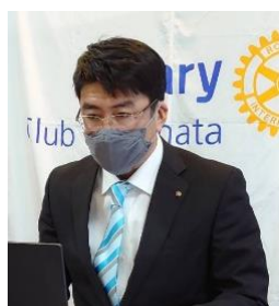
本日の司会進行 & ニコニコ BOX 紹介 副 SAA 三箇会員