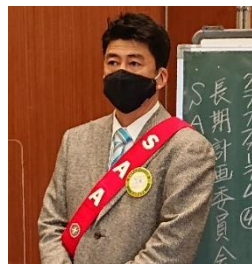
副SAA 二箇会員 本日の司会進行