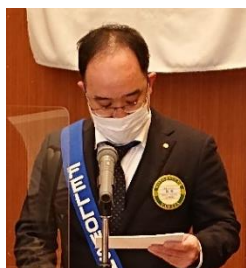
ニコニコBOX 紹介 岡崎会員