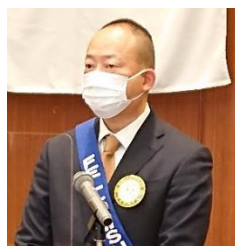
四つのテスト 島村会員