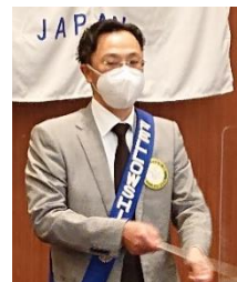
ソングリーダー 大下会員