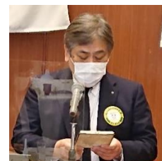
出席状況報告 安部会員