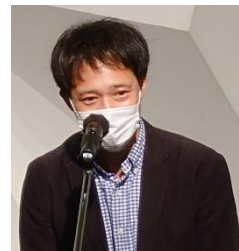
今秋 真打昇進!! おめでとうございます