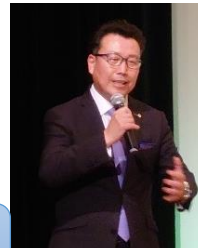
奉仕事業植木理事