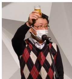
乾杯のご発声 中野副会長