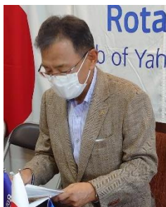
ニコニコBOX 紹介 萩本会員