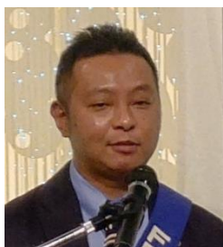
ニコニコBOX紹介 春田会員