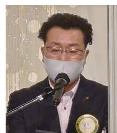
出席状況報告 植木会員