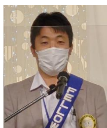
四つのテスト 山路会員