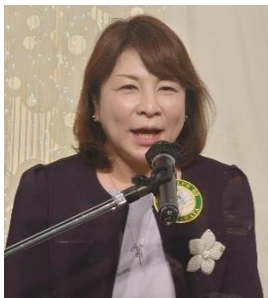
締めのご挨拶 古賀会長エレクト