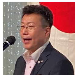
四つのテスト 植木会員