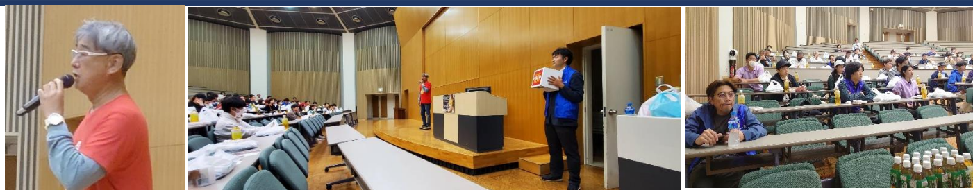
峯浦地区委員長よりポリオについて、詳しく説明していただきました。