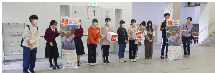
九州国際大学附属高校インターアクトクラブの生徒さんがポリオ基金の募金集めをしてくださいました。