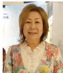
四つのテスト 敷田会員