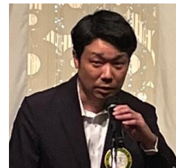
出席状況報告 尾島会員