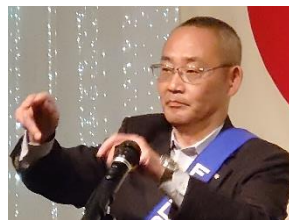
ソングリーダー 神田会員