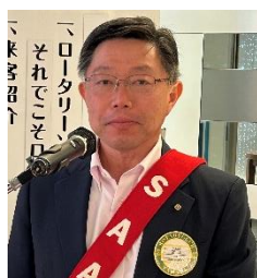
本日の司会 副 SAA 宮津会員