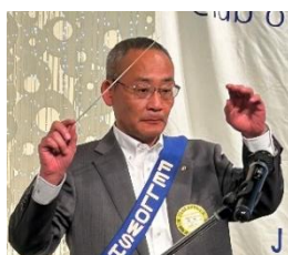
ソングリーダー 神田会員