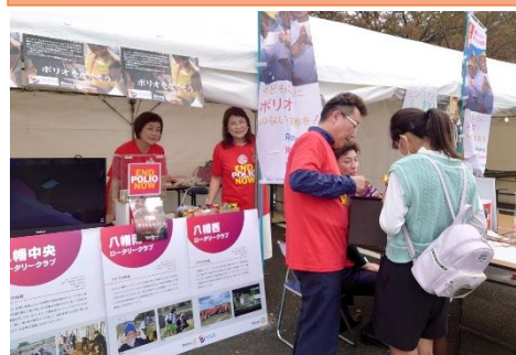
エンドポリオブースで募金活動をしました。