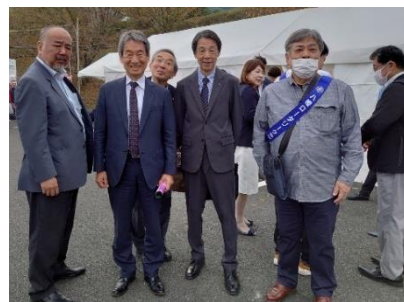
料亭松助にて昼食 午後は清掃活動とエンドポリオ ブースへ!!