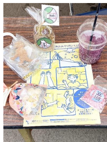
八幡ロータリークラブのメンバーは表彰式のお手 伝い。九州国際大学付属高校インターアクトクラブは お土産の企画から当日販売まで積極的に活動しまし た。