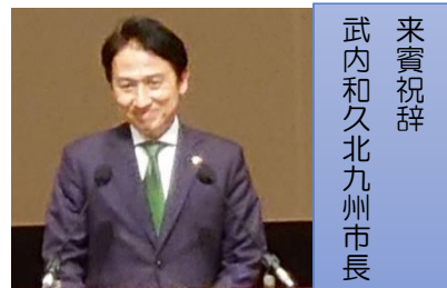
来賓祝辞 武内和久北九州市長