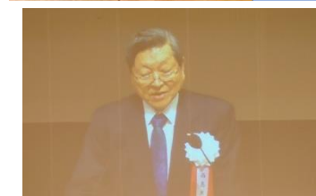
RI2700 地区 西島英利ガバナー 「国際ロータリー現況報告」