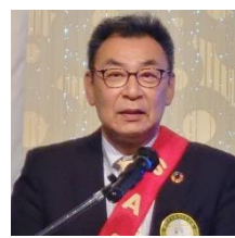
四つのテスト 神力会員