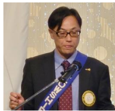
ソングリーダー 大下会員