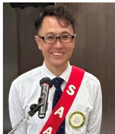
本日の司会 副 SAA 大下会員