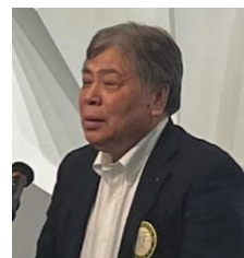
四つのテスト 安部会員