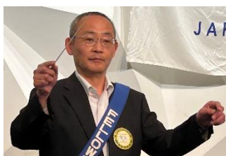
ソングリーダー 神田会員