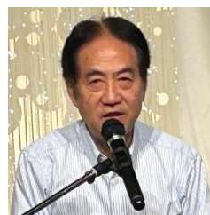
四つのテスト 島添会員