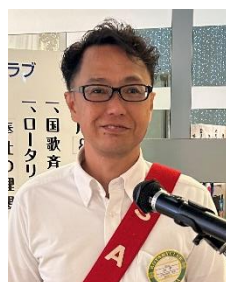
本日の司会 副 SAA 大下会員