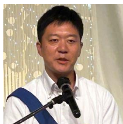
ニコニコBOX 紹介 五嶋会員