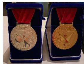
東京オリンピックメダル