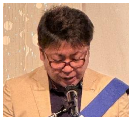
ニコニコ BOX 紹介 古賀亭会員