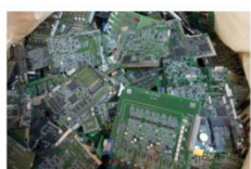
家電から回収された電子基板