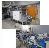
世界唯一の機械装置