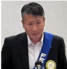
ニコニコ BOX 紹介 徳永会員