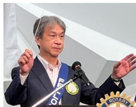
ソングリーダー 水上会員