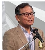
四つのテスト 萩本会員