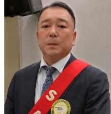
ニコニコ BOX 紹介 SAA 波多野会員