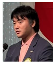
四つのテスト 寺下会員