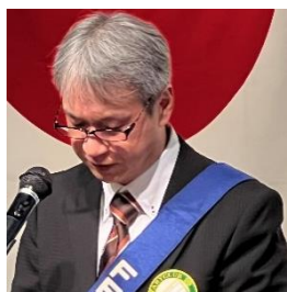
ニコニコ BOX 紹介 水上会員