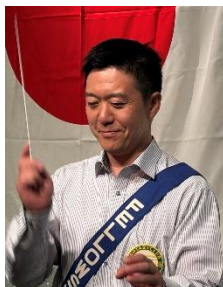
ソングリーダー 五嶋会員