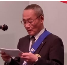
ニコニコBOX 紹介 神田会員