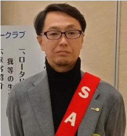
副 SAA 大下会員 本日の司会

本日のお食事は、100万ドルの食事でカレーでした。 ☆100万ドルの食事とは・・・ 例会の食事を月1回粗食にして節約した資金を、社会奉仕や国際奉仕などの活動に充てる取り組みです。 この取り組みは、世界中のロータリー会員が50万人程度だった頃に始まり、当時のロータリアン全員が1人当たり2ドル節約すると、総額100万ドルの資金が確保できることに由来しています。