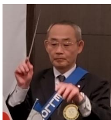
ソングリーダー 神田会員