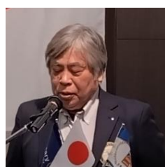
四つのテスト 安部会員