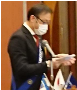
ニコニコBOX 紹介 白石会員