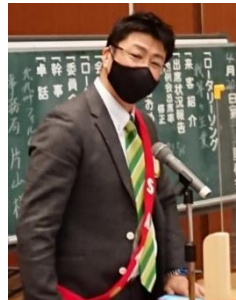
本日のS A A 三箇会員