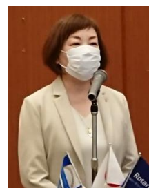
四つのテスト 中尾会員