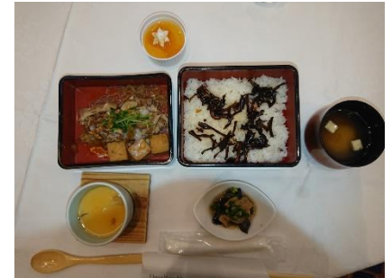
本日のお食事!(^~)! 100万$のお食事です