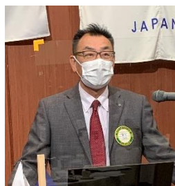
四つのテスト 神力会員