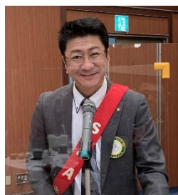
本日の SAA 三箇会員