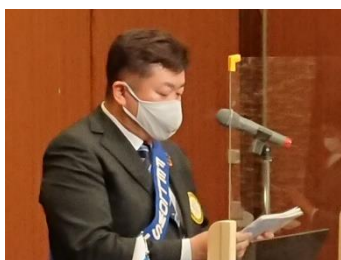
ニコニコ BOX 紹介 有吉会員