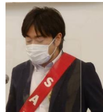
四つのテスト 瀧口会員