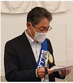
ニコニコBOX紹介 福田(公)会員