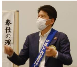
ソングリーダー 網岡会員