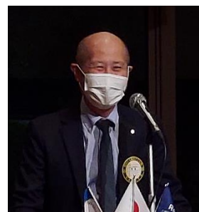
四つのテスト 荒添会員