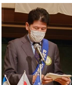
ニコニコBOX紹介 会員