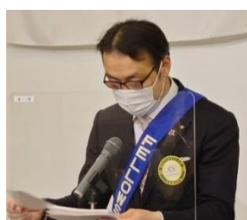
ニコニコBOX 紹介 白石会員