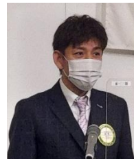
四つのテスト 高増会員