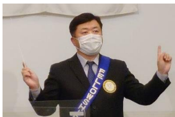
ソングリーダー 有吉会員