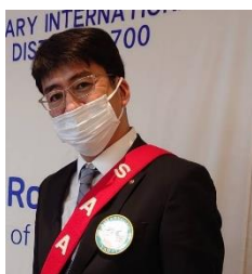
本日の司会進行 & ニコニコ BOX 紹介 副 SAA 三箇会員