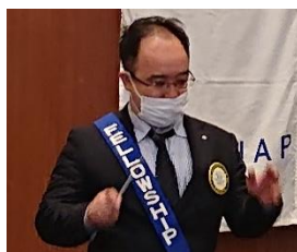
ソングリーダー 岡崎会員