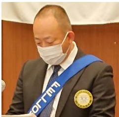
ニコニコ BOX 紹介 島村会員