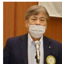
四つのテスト 安部会員