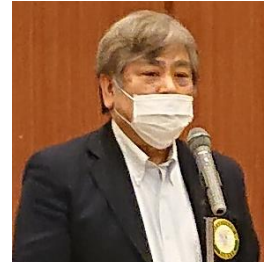
出席状況報告 安部会員