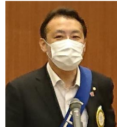
四つのテスト 白石会員