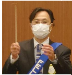
ソングリーダー 大下会員