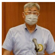
四つのテスト 峯浦会員