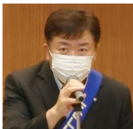
ニコニコBOX 紹介 有吉会員