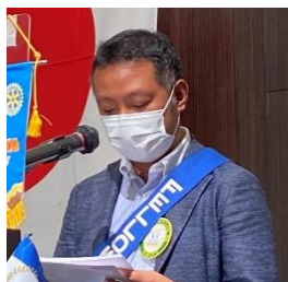
ニコニコ BOX 紹介 春田会員