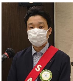
本日の司会進行 SAA 尾島会員