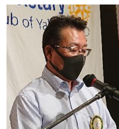
出席状況報告 植木会員