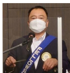
ソングリーダー 会員