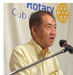
四つのテスト 会員