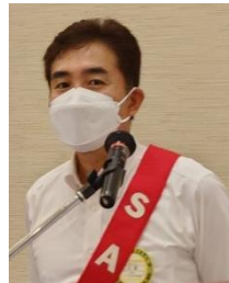
SAA 尾島会員&副 SAA 川原会員