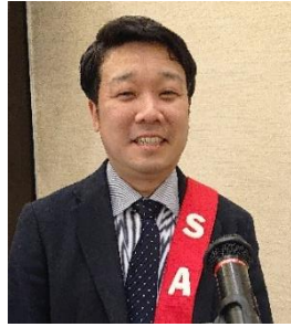
本日の司会 SAA 尾島会員