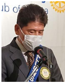
ニコニコ BOX 紹介 網岡会員