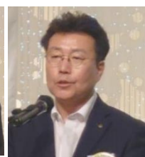
出席状況報告 植木会員