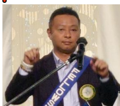
ソングリーダー 春田会員