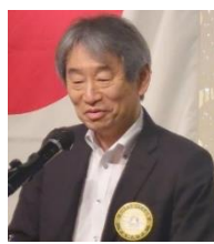
四つのテスト 岡橋会員