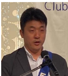
ニコニコBOX紹介 山路会員