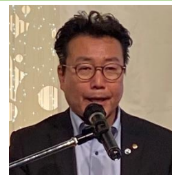
出席状況報告 植木会員