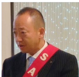
副SAA 島村会員 本日の司会