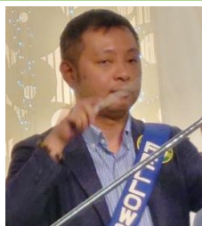
ソングリーダー 春田会員