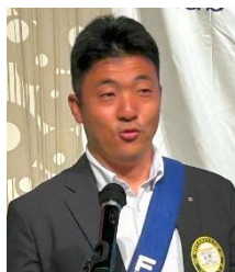
ニコニコ BOX 紹介 山路会員