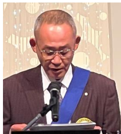
ニコニコ BOX 紹介 神田会員