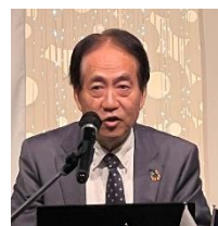
四つのテスト 島添会員