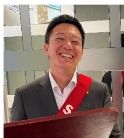
本日の司会 副SAA 五嶋会員