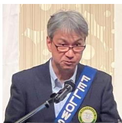
ニコニコBOX紹介 水上会員