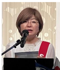
四つのテスト 永野会員