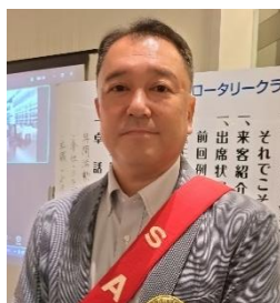
SAA 波多野会員 本日の司会