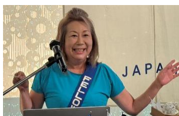
ソングリーダー 敷田会員