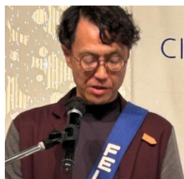
ニコニコBOX紹介 大下会員