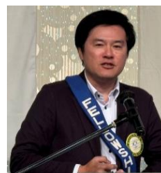
四つのテスト 豊田会員