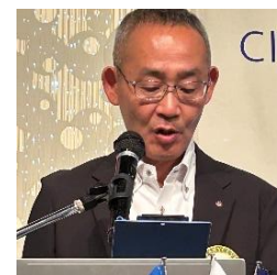
出席状況報告 神田会員