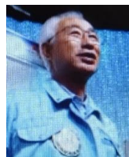
四つのテスト 大場会員