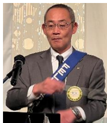
ソングリーダー 神田会員