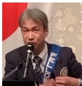
ニコニコBOX 紹介 水上会員