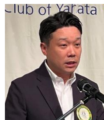
四つのテスト 尾島会員