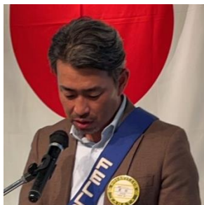
ニコニコ BOX 紹介 武田会員