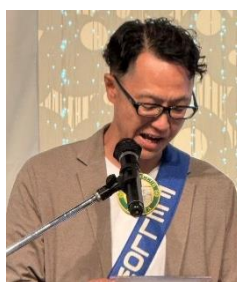
四つのテスト 大下会員