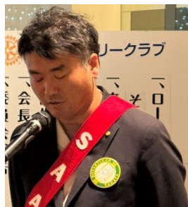
本日の司会 SAA 寺下会員