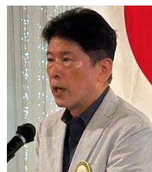
四つのテスト 網岡会員