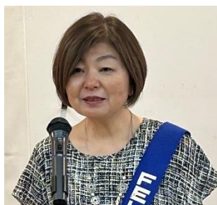
ニコニコBOX紹介 永野会員