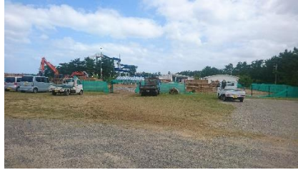
②駐車場手前の広場へ